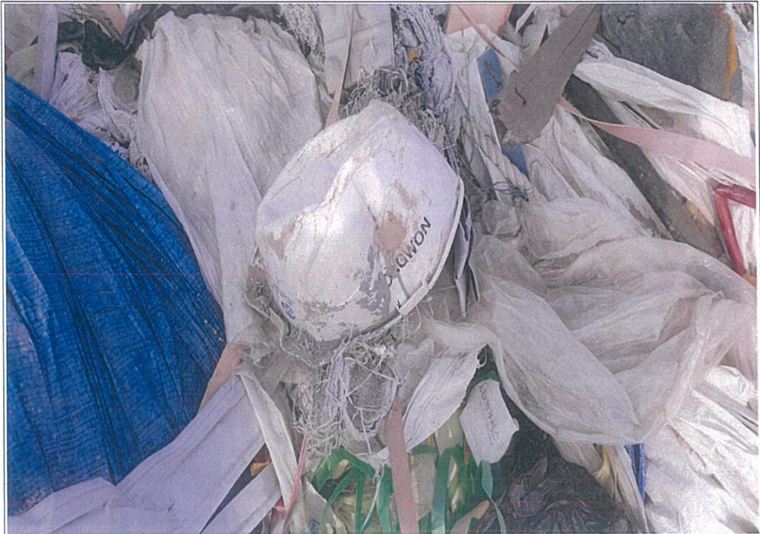
폐기물 성상 - ②