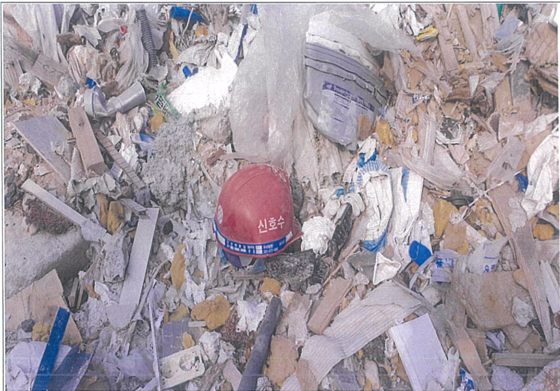
폐기물 성상 - ⑤