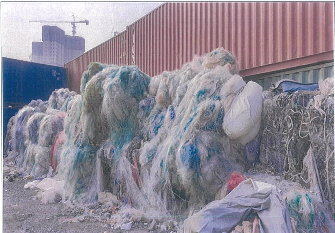
폐기물 성상 - ⑦