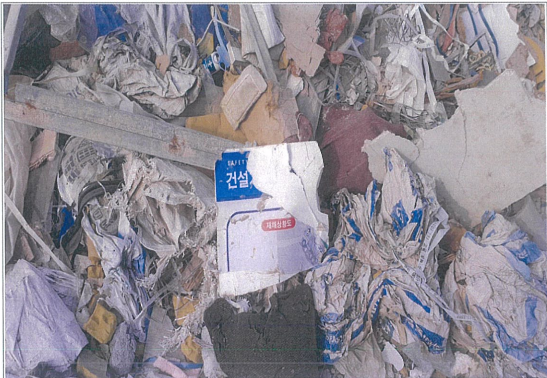
폐기물 성상 - ③