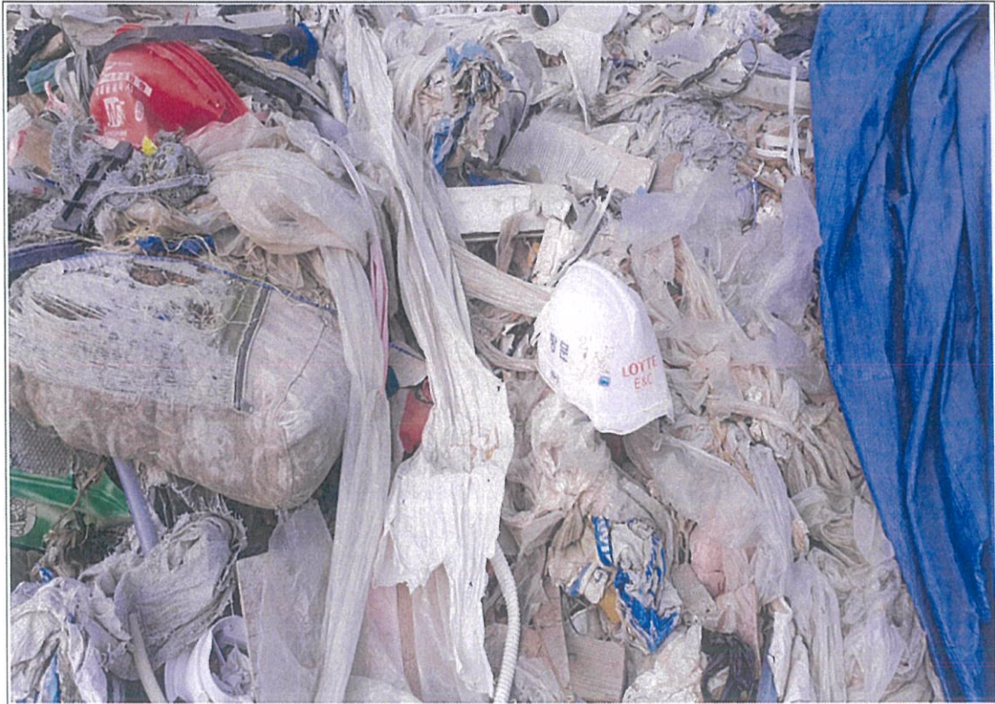
폐기물 성상 - ④