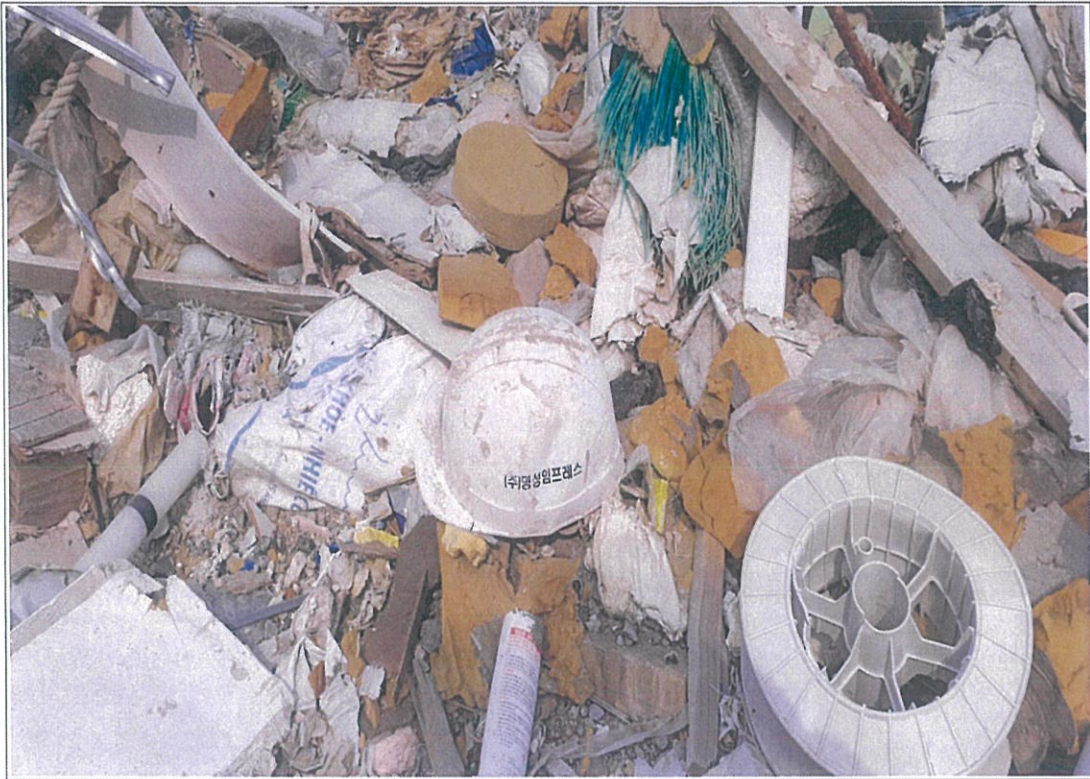
폐기물 성상 - ⑥