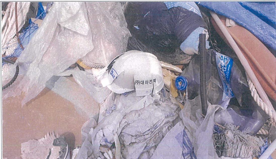
폐기물 성상 - ①